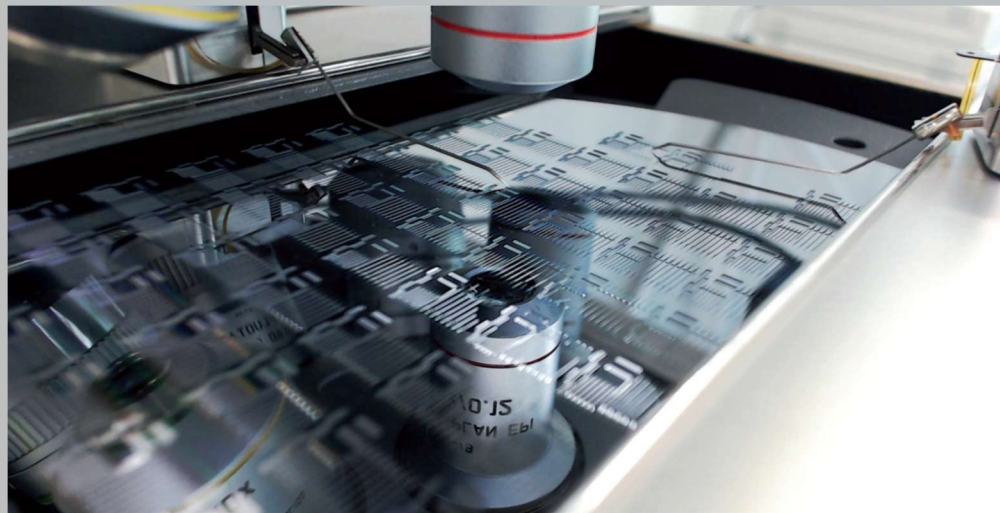
Abbildung 2: Waferkontaktierung mit Mikromanipulatoren