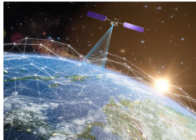
Satellit für Erdbeobachtung