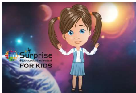
Erklärvideo Surprise4Kids