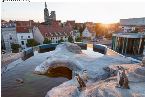
Pinguine im OZEANEUM Stralsund